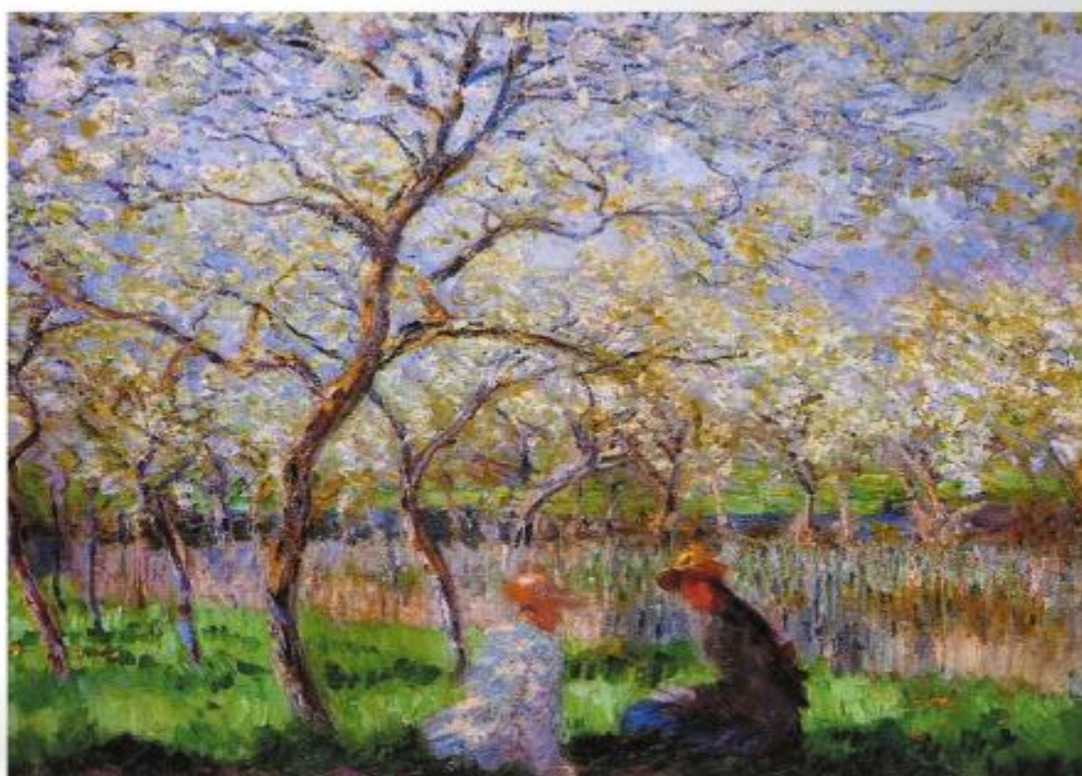
Claude Monet Wiosna