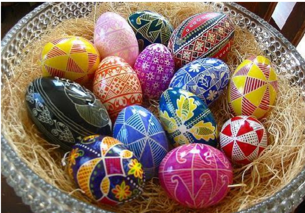
Pisanki , Oznaki nowego życia