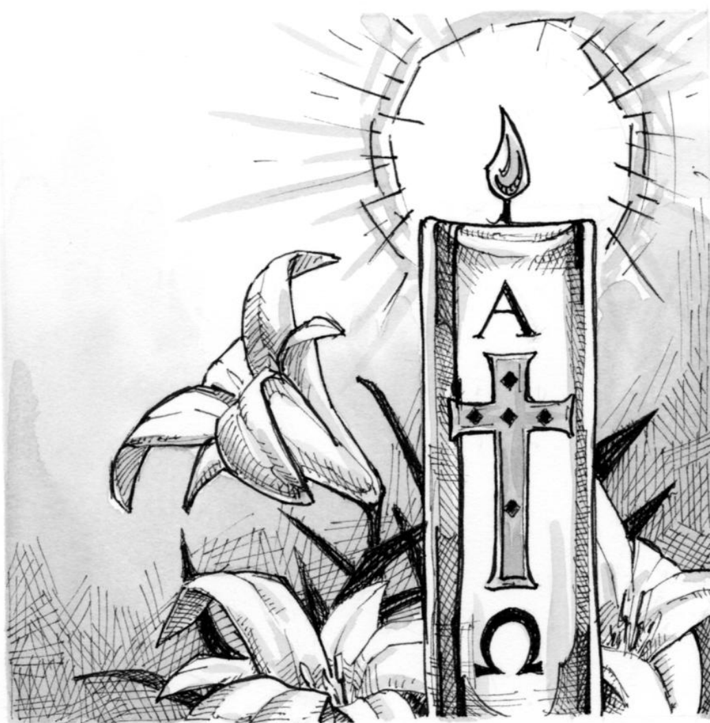
Świeca Wielkanocna – Paschał